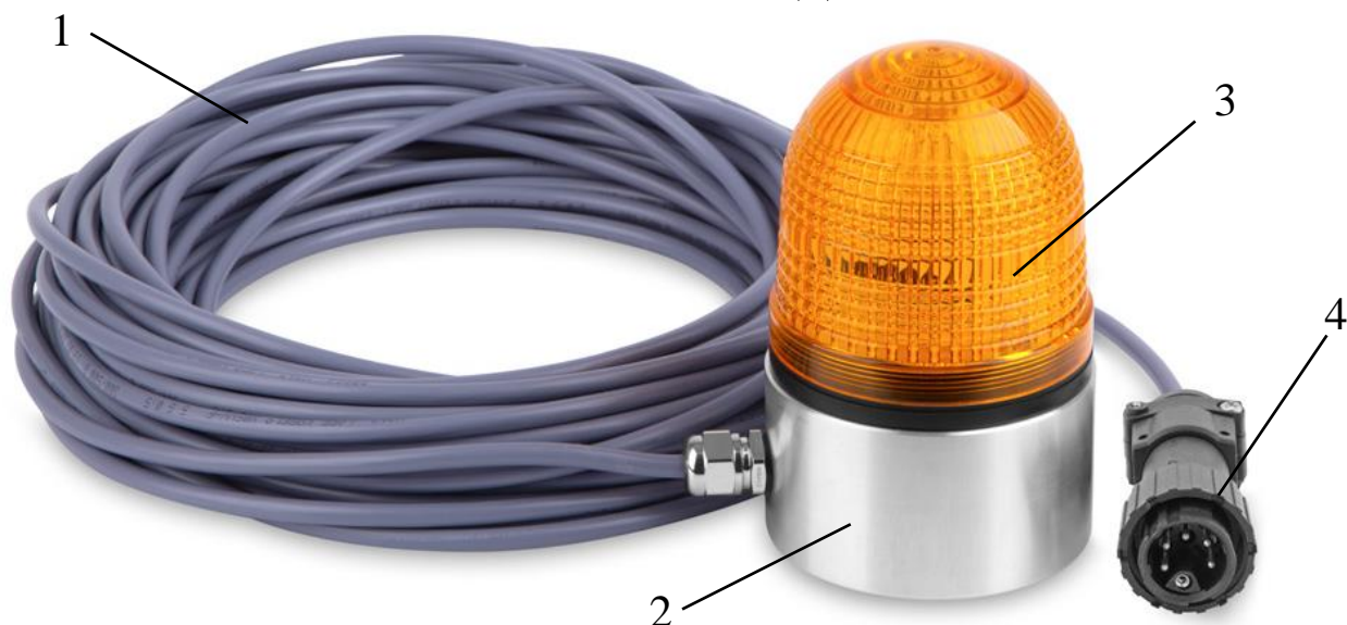
Рисунок 1 – Общий вид изделия