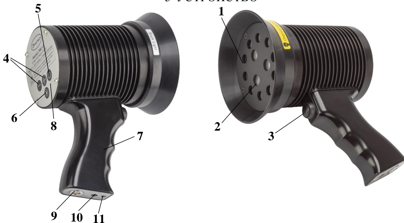
Рисунок 1 – Общий вид светодиодного ультрафиолетового светильника Элитест УФС-220 Black Light